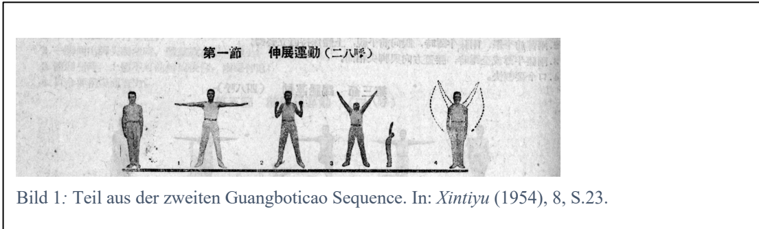
Bild 1: Teil aus der zweiten Guangboticao Sequence. In: Xintiyu (1954), 8, S.23.

Bilder und Tabellen im Anhang oder Hauptteil: